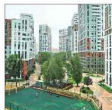
■ Жилой комплекс «Гарден Парк Эдальго», где проживает автор

■ Мне всегда были и остаются интересны места, где я живу. Когда я переехала в 2017 году в поселок Коммунарка Новой Москвы, то с интересом стала изучать историю местности. К тому времени уже прошло пять лет с момента, когда поселок был присоединен к столице.