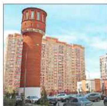
■ Еще одна достопримечательность района – водонапорная башня