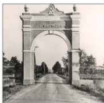
■ Своеобразный символ поселка – арка с надписью «Коммунарка»