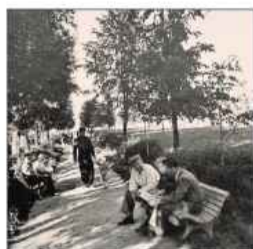
■ Липовый парк, посаженный работниками совхоза «Коммунарка»