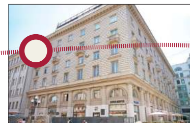
Арбат, 45. Остановка вторая «Научная».