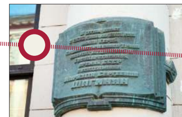
Арбат, 45. Остановка третья «Писательская».