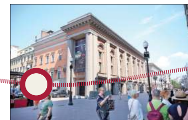
Арбат, 26. Остановка седьмая «Театральная».