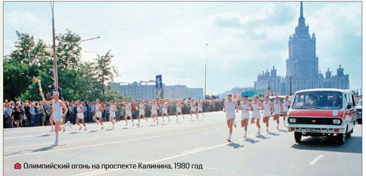
Олимпийский огонь на проспекте Калинина, 1980 год

Мы тоже пошли домой. По дороге я спросила подругу: «А чего я орала-то? Я в жизни никогда не кричу. Что это было?» Она, смеясь, ответила: «Это на-