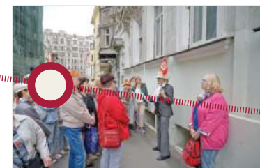
Арбат, 28. Остановка шестая «Бардовская».