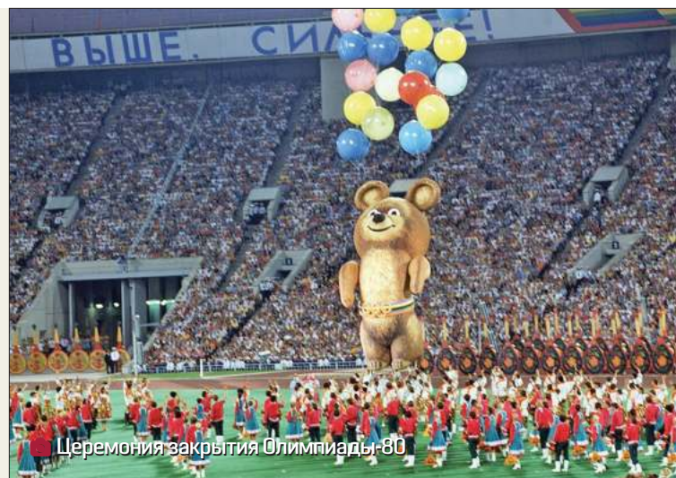
Церемония закрытия Олимпиады-80

ный стадион. Это там, где был установлен факел с олимпийским огнем, где проходили церемонии открытия и закрытия Олимпийских игр. Нам поставили задачу – развернуть резервную сеть телефонной связи. Аппаратная, где установили пульты связи, располагалась на самом верху, над коммандорскими кабинетами. Большие панорамные окна прямо напротив олимпийского факела. В помещении установили ручные пульты связи, которые исполь-