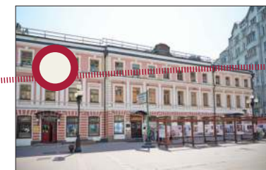
Арбат, 33. Остановка пятая «Философская».