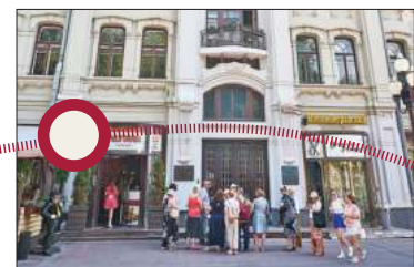
Арбат, 23. Остановка восьмая «Скульптурная».