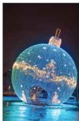
Самое большое новогоднее украшение – 20-метровый елочный шар, установленный на Поклонной горе. В нем можно загадать желание