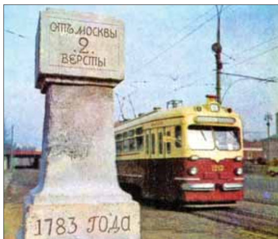
■ Одна из реликвий Рогожской заставы – верстовой столб, установленный в 1783 году

заядлый рыбак, и к тому же у нас в квартире был аквариум с разными рыбками и водными растениями, конечно же, маршрут до такого притягательного места я выучила чуть ли не с пеленок.