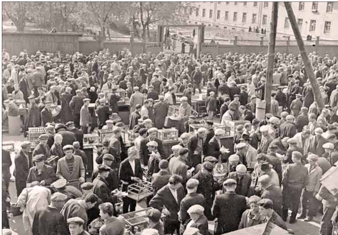
■ На Птичьем рынке на Большой Калитниковской было интересно побродить среди шума людских голосов, лая, мяуканья, птичьего гомона

Вскоре стал меняться вид района в целом. Уходили в прошлое деревянные дома и магазины, окрестность застраивалась па-