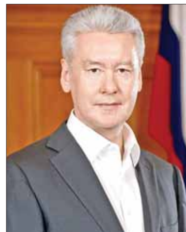
Сергей Собянин, Мэр Москвы:

«Уже обновлено больше 10 исторических павильонов и 26 объектов культурного наследия. В этом году планируем завершить реставрацию и строительство больше десятка павильонов, среди них «Мясная промышленность», «Атом», Выставочно-культурный и экспозиционный центр Республики Узбекистан. На ВДНХ откроются новые достопримечательности – парк «Орион» и «Лента Мебиуса».