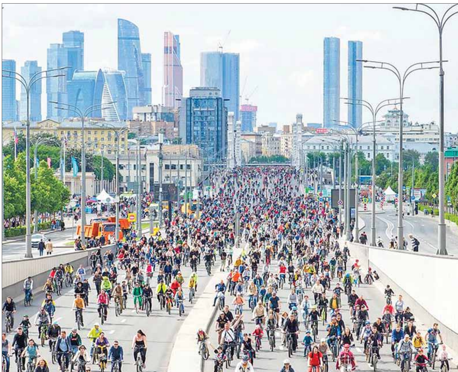
21 мая в столице прошел ежегодный Московский велофестиваль, который собрал около 50 тысяч велолюбителей

километров велодорожек доступно в Москве. Идет работа над запуском веломаршрута «Зеленое кольцо».