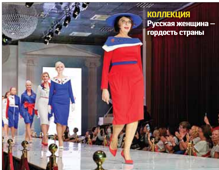
КОЛЛЕКЦИЯ Русская женщина – гордость страны