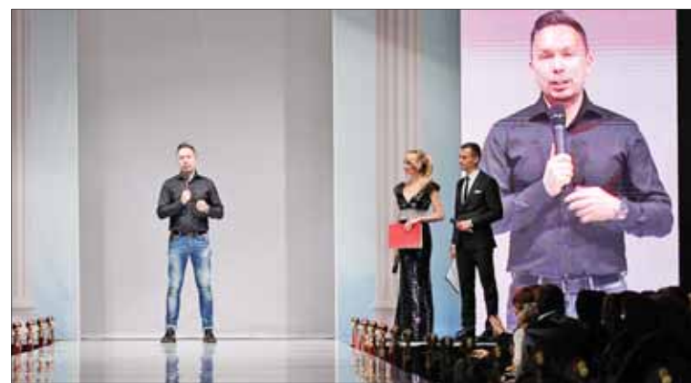
Владимир Филиппов , заместитель руководителя столичного Департамента труда и социальной защиты населения города Москвы:

– Я спросил своих учениц, о чем они мечтали в 15–17 лет?.. И после долгих обсуждений выяснилось, что многим нравится классика – а это черное и белое. И так как возникла идея коллекции – воплотить эти цвета с помощью образов игры в шахматы. Но так я по натуре бунтарь, то было решено внести немного хулиганства и в наши модели.