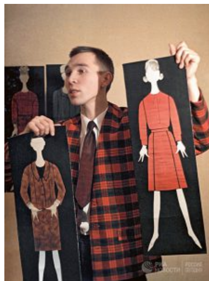
Март 1964 г. Художник-модельер Вячеслав Зайцев с эскизами в руках.

музея дизайна и частных коллекций: мебель, посуда, одежда, книги, чертежи, плакаты, открытки, альбомы, этикетки, созданные на таких предприятиях, как «Зенит», ЗИЛ, ВАЗ и ЛОМО.