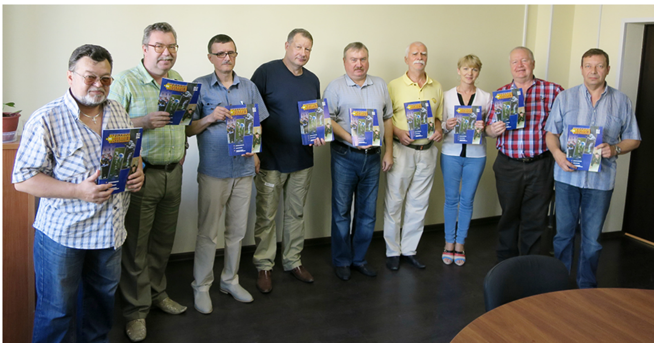
Редакция журнала «Вестник военного образования» с первым номером издания.