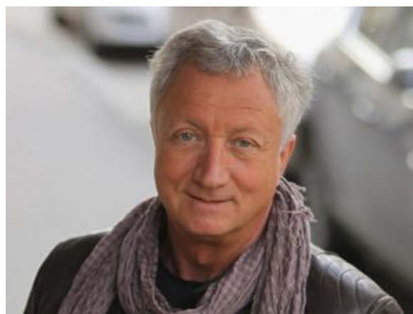
Валерий Выжutowич.

Первого августа ЦИК начал принимать заявки на аккредитацию представителей СМИ, освещающих выборы в Госдуму.