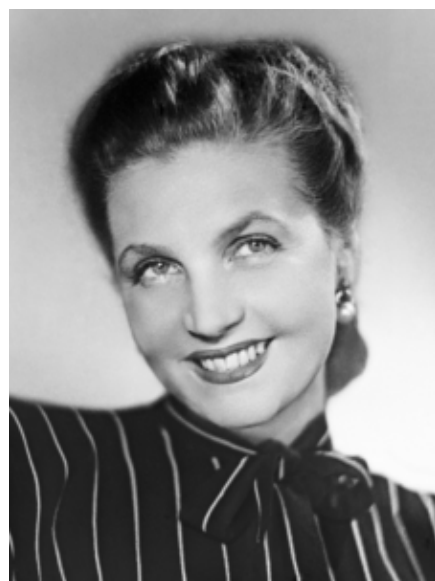
Актриса Тамара Макарова. 1945 г.

«Я очень рада, что ТАСС наконец-то открылся – он всегда открыт как новостной ресурс, как площадка для общения, как коллектив людей – но теперь он открыл свои архивы – то, что часто для обывателей, непрофессионалов остается недоступно», – добавила она.