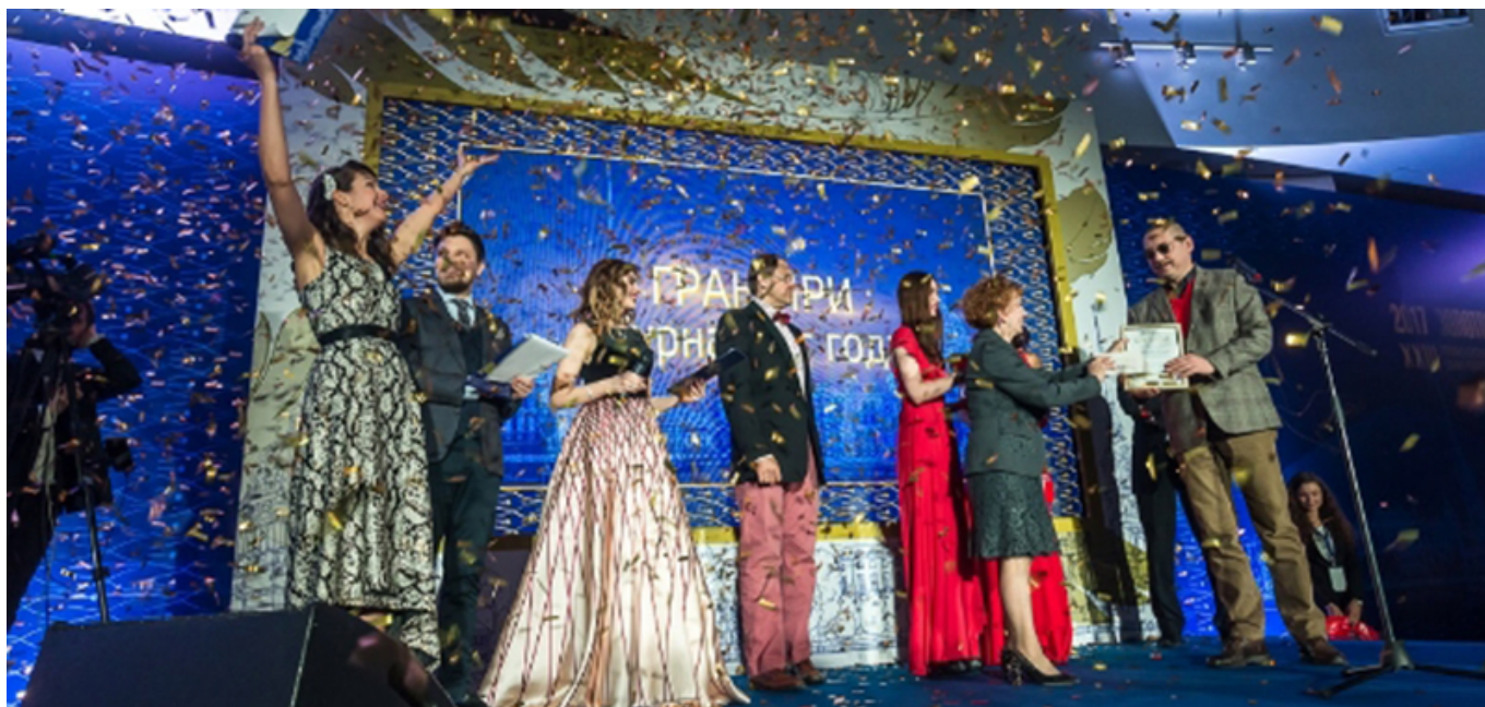
3 апреля 2018 г. http://spb.kp.ru Фото: Дмитрий Фомичев