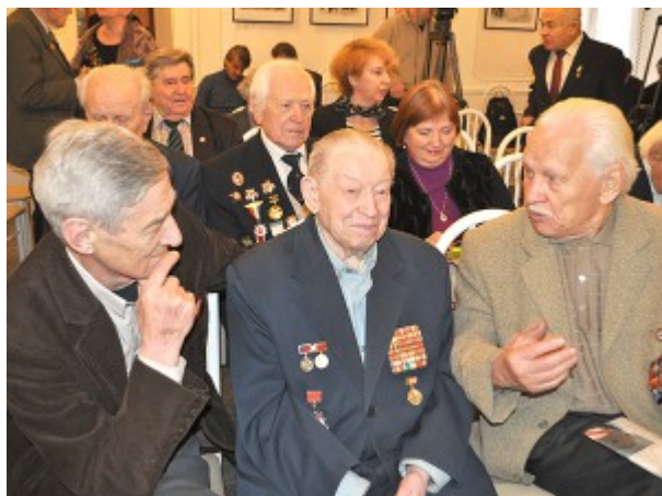
Заметки с круглого стола

4 декабря, 2015 г. в связи с 74-й годовщиной начала контрнаступления советских войск под Москвой прошел круглый стол, посвященный работе фронтовых журналистов и кинооператоров в ходе осуществления этой операции, с приглашением ветеранов Великой Отечественной войны – участников битвы под Москвой.