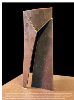
Б. Черствый, Ю. Зубенко