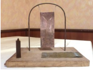
Б. Черствый, Ю. Зубенко