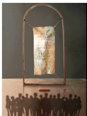
Б. Черствый, Ю. Зубенко