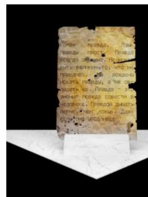
Б. Черствый, Ю. Зубенко