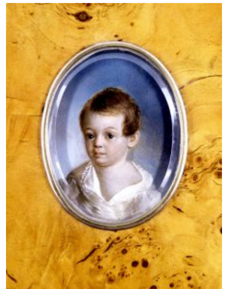
Ксавье де Местр. Пушкин-ребенок. 1802, металлическая пластина, масло.

Существует несколько портретов Пушкина, более-менее дающих представление о его внешности: вот он – юный лицеист, вот – Пушкин уже солидный, кисти Кипренского... Но представить Александра Сергеевича ребенком долгое время возможности не было. Пока однажды не случилось настоящее чудо.