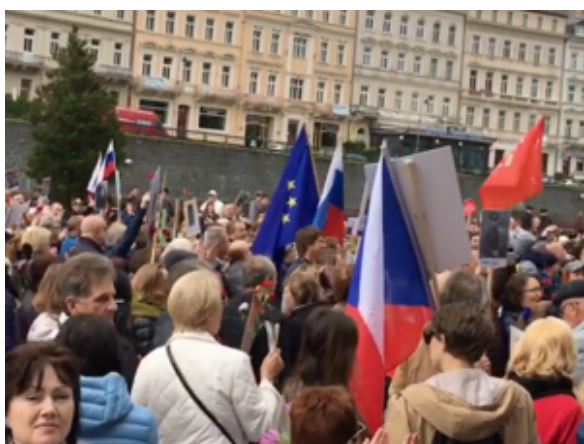
Шествие Бессмертного полка в Карловых Варах.

В самолете на рейсе Москва – Прага я взял в руки последний номер еженедельного чешского журнала Tyden («Неделя»). Не было ничего удивительного в том, что с обложки на читателя смотрели из сорок пятого года лица молодых советских танкистов на фоне знаменитой «тридцатьчетверки». Кому как не чехам отдать в эти дни должное нашим воинам, которые обильно проливали свою кровь за свободу Европы. Сто сорок тысяч советских солдат и офицеров отдали свои жизни в боях на территории Чехословакии.