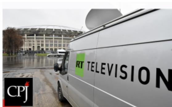
Russia's RT network says it complied with US order to register as foreign agent

Американское бюро телеканала Russia Today в понедельник под давлением министерства юстиции США зарегистрировалось в качестве иностранного агента. Такое требование властей США – крайне редкое для средств массовой информации, работающих на американской территории. В списке иноагентов зарегистрированы всего три СМИ, а подавляющее большинство, в том числе финансируемые государством британская BBC и китайский CCTV,