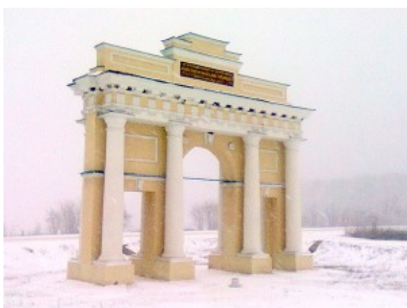
Диканька. Триумфальная арка.

С 1687 года Диканька стала принадлежать роду Кочубеев.